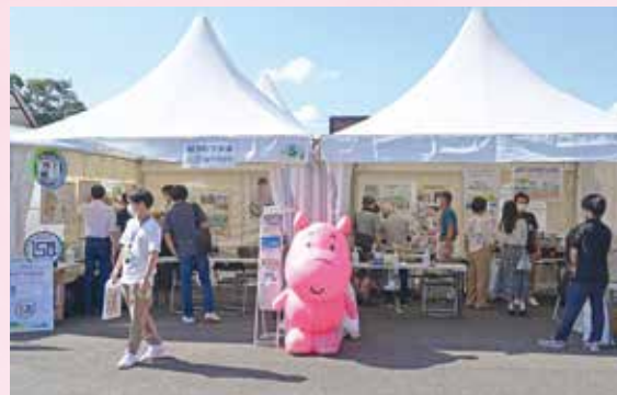
●環境創造局下水道事業PR